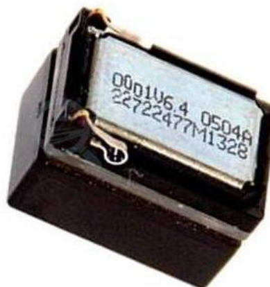
Minireproduktor ZIMO LS10x15mm