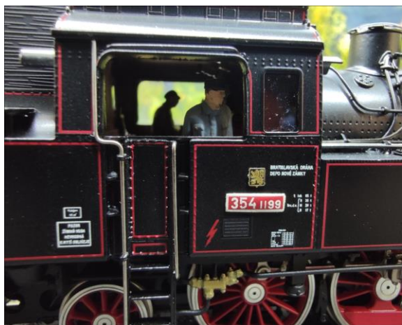
Doplnění figurek do budky lokomotivy

Pro ještě věrnější vzhled Vašeho digitalizovaného a ozvučeného modelu můžete využít možnosti doplnění postaviček strojvedoucího a topiče. Při demontáži modelu je to ideální příležitost. Používáme figurky Preiser, které od nás dostávají ještě drobnou barevnou úpravu a patinu.