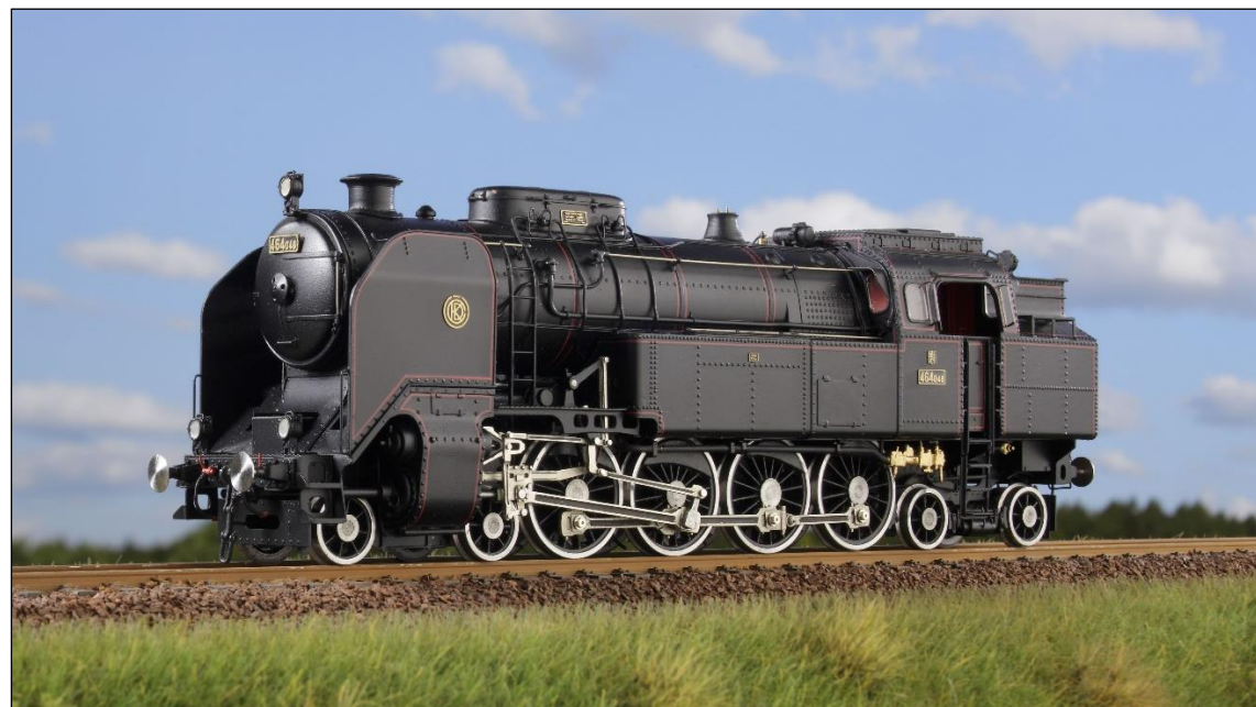
Model lokomotivy 464 048 od pana J. Pomahače