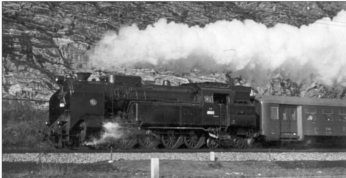
0405 ČSD 464 073