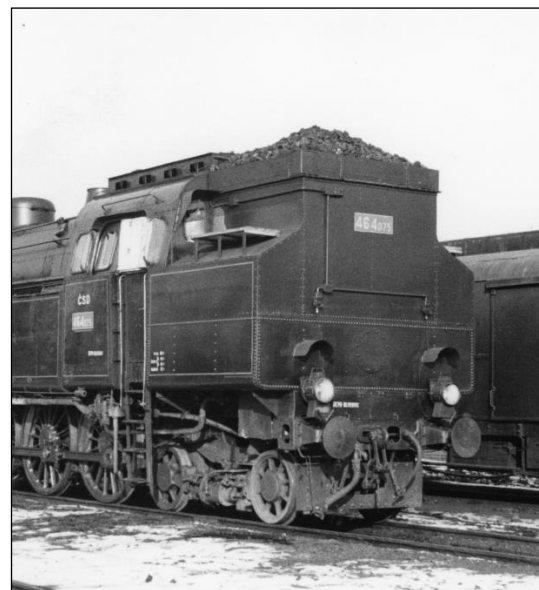
ČSD 464 075 Provedení nástavby uhláku pro všechny edice