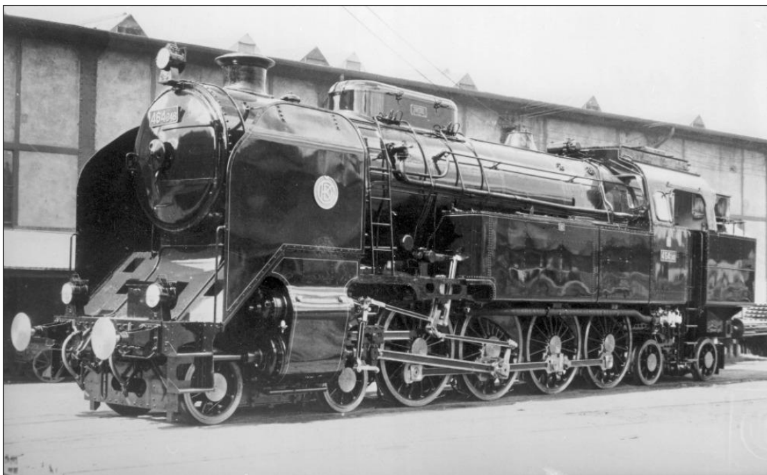
0402 ČSD 464 048