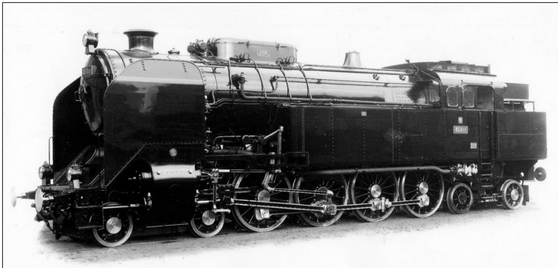
0401 ČSD 464 011