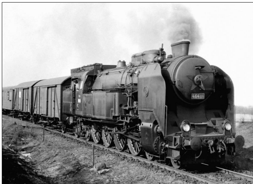
0406 ČSD 464 071