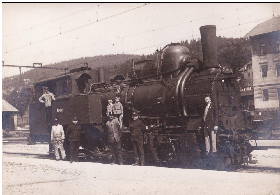
0217 ČSD 404 002