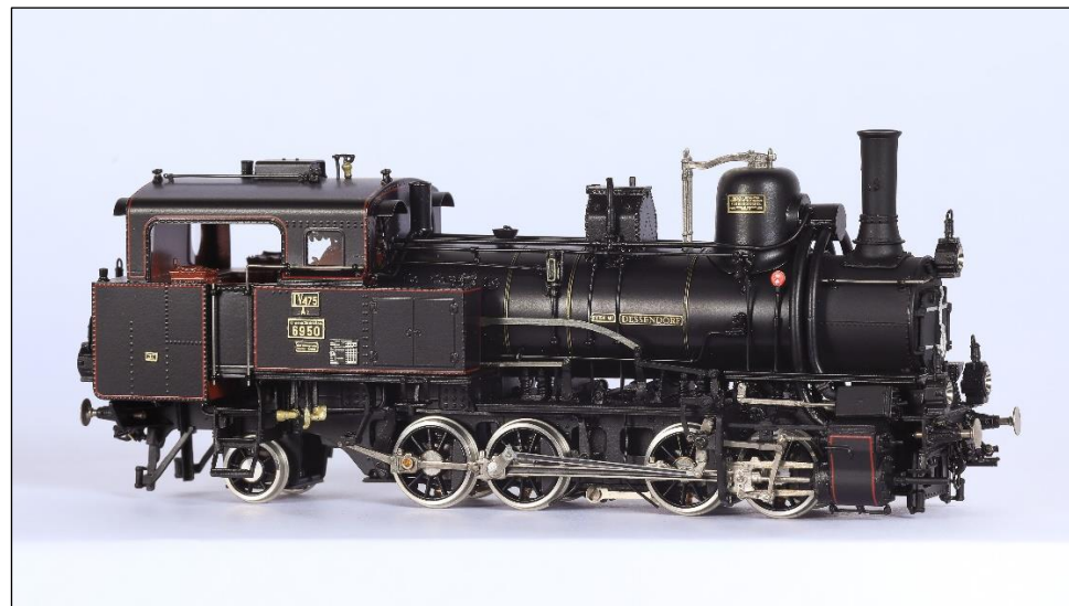
(edice 0214 – 0216 odpovídají provedením edici 0208 kkStB 6950 Dessendorf)