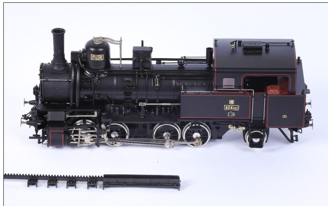
(edice 0217 a 0218 odpovídá edici 0207 ČSD 404 001)