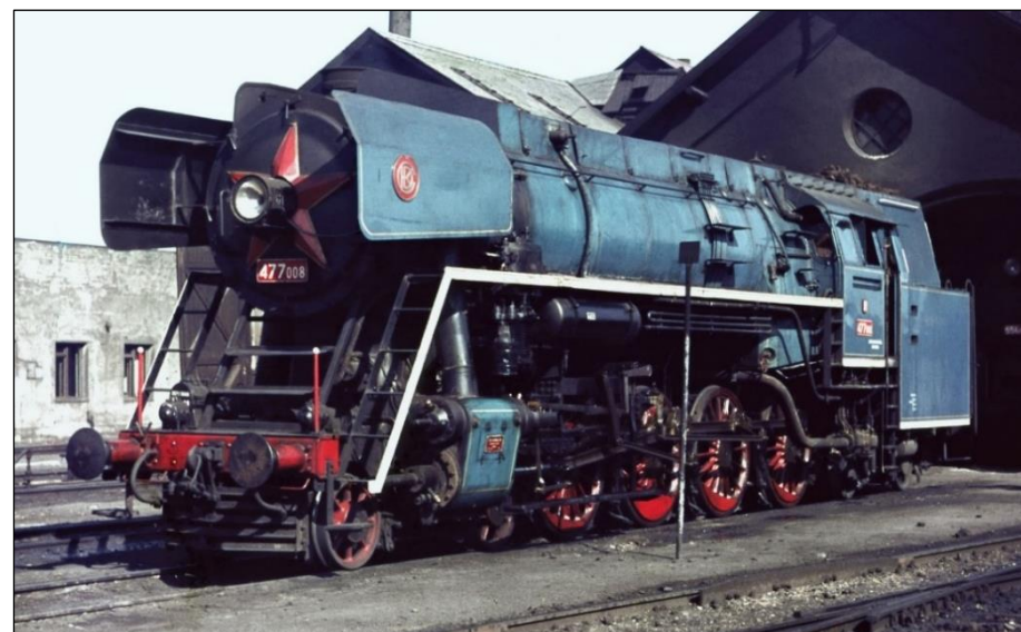
0309 ČSD 477 008