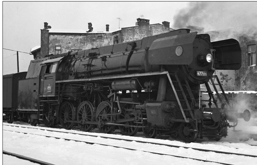
0311 ČSD 477 033