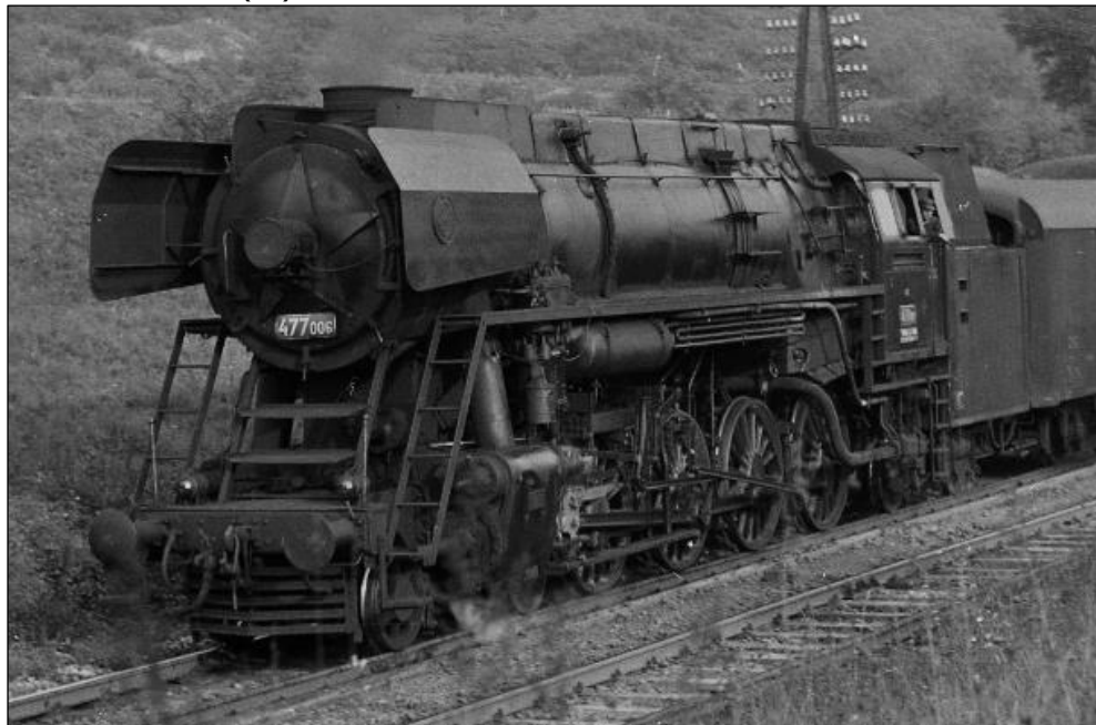
0310 ČSD 477 006