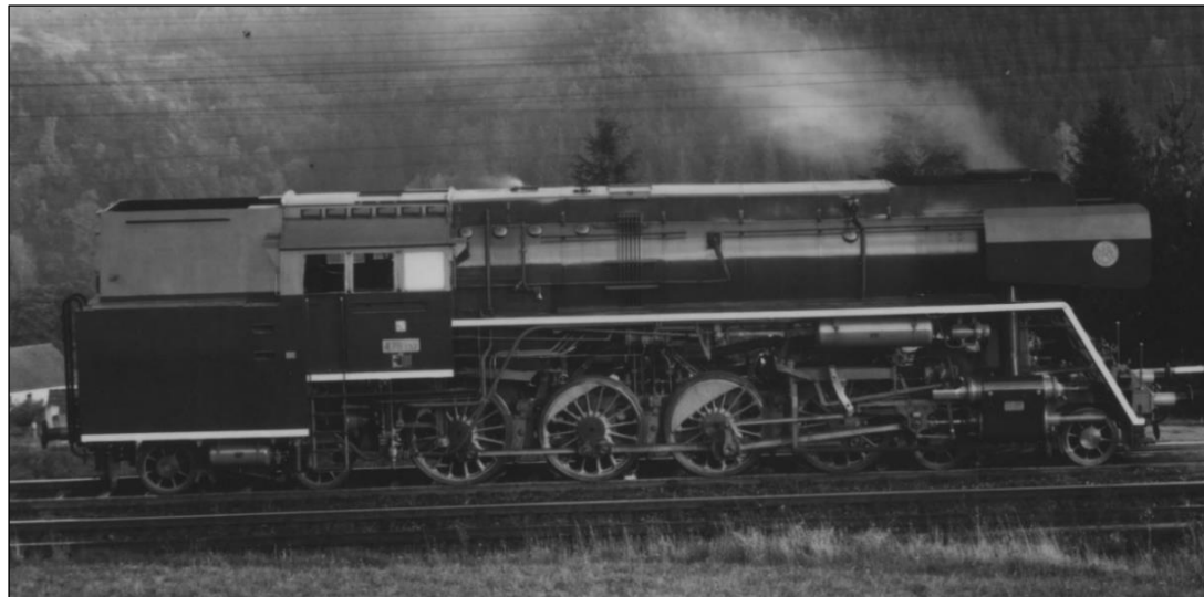
0308 ČSD 476 137