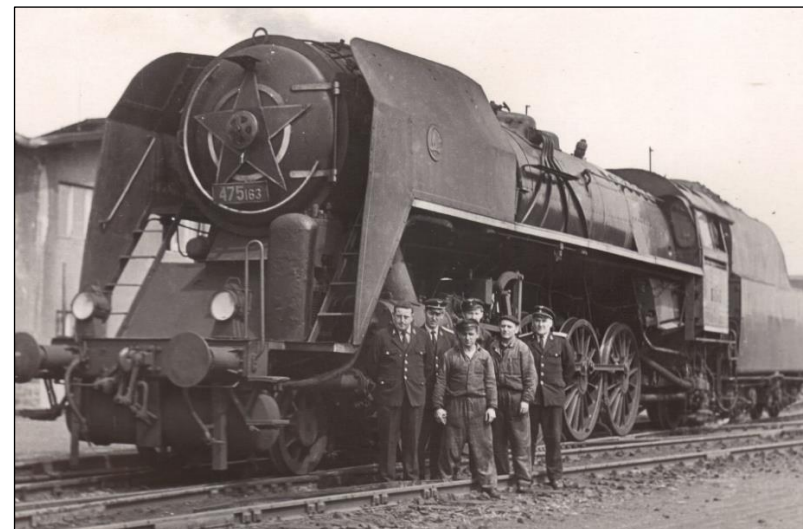
0505 ČSD 475 163