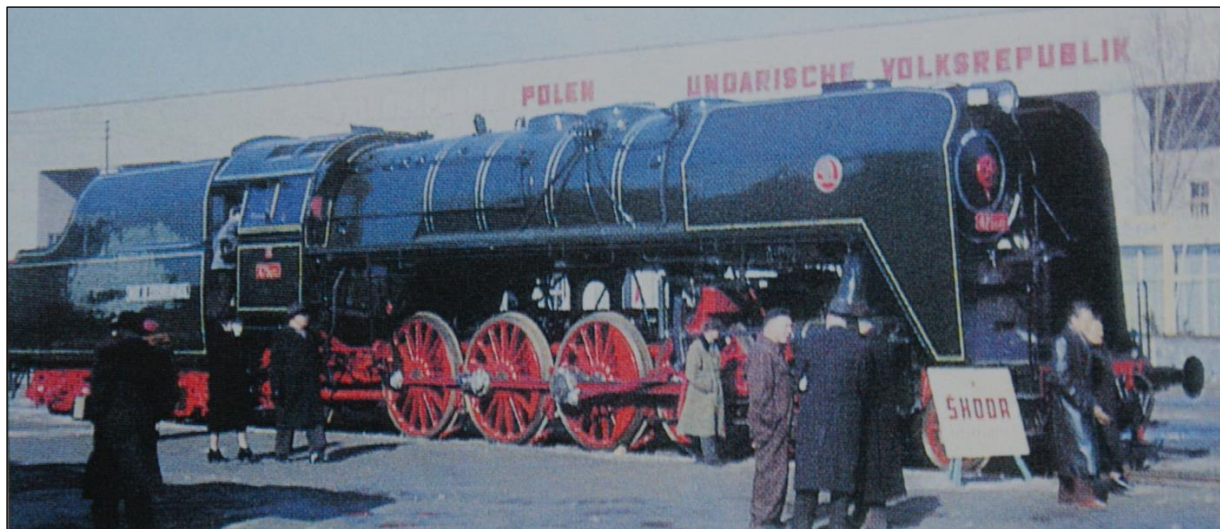
0503 ČSD 475 1142