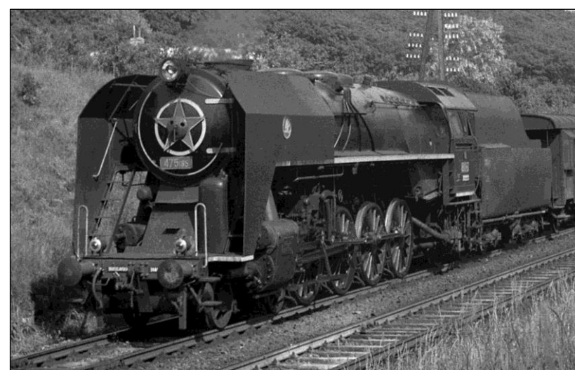
0504 ČSD 475 185