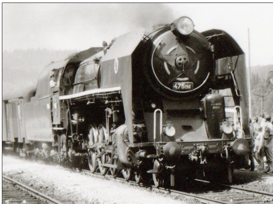
0506 ČSD 475 196